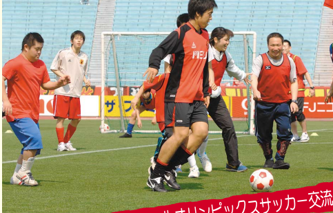
スペシャルオリンピックスサッカー交流ゲーム