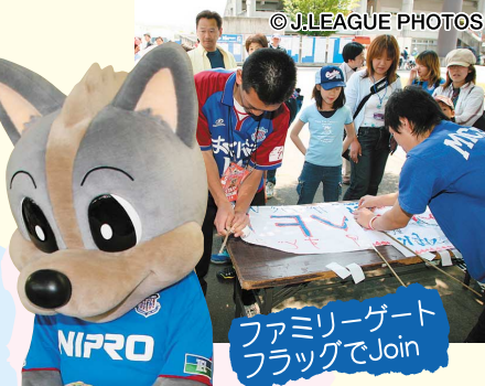
ファミリーゲートフラッグでJoin