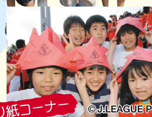
子供の日 折り紙コーナー