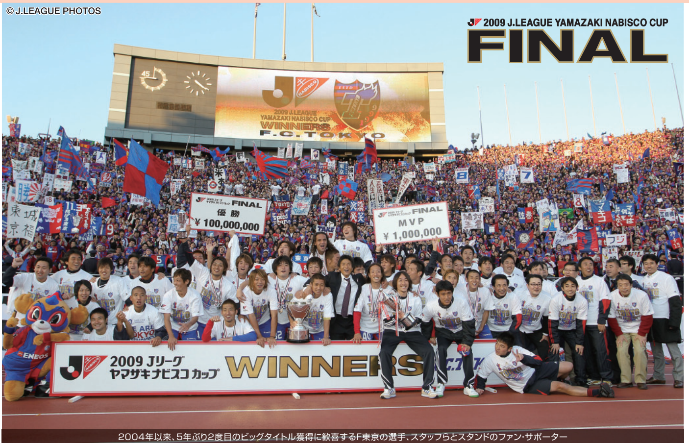
2004年以来、5年ぶり2度目のビッグタイトル獲得に歓喜するF東京の選手、スタッフらとスタンドのファン・サポーター