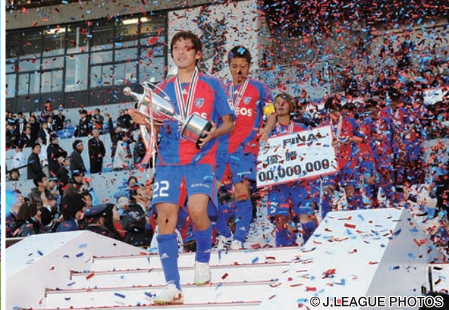
ロイヤルボックスでの表彰式を終えてピッチに向かうF東京の選手たち